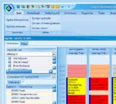
Integrale monteuragenda functie